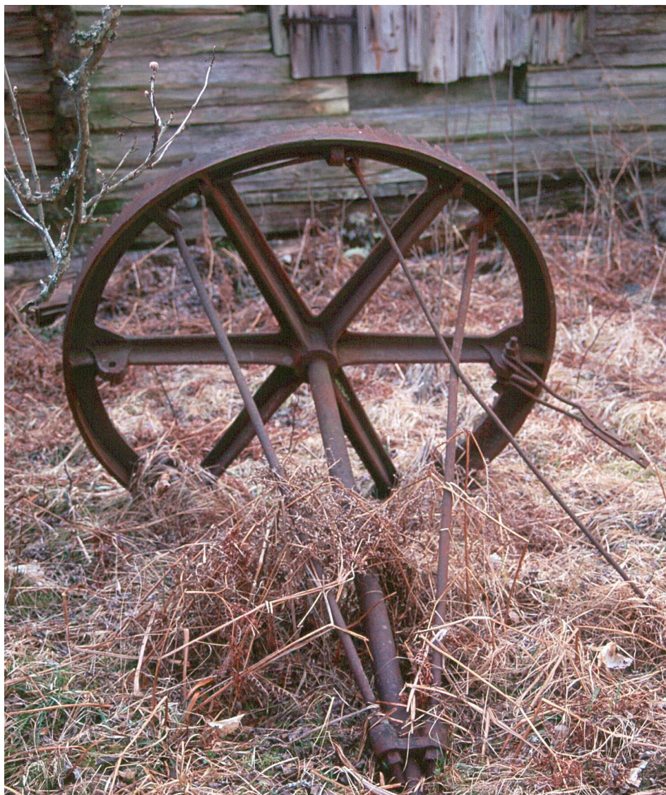
[Bild tagen bakom logen vid Ekhagen 1997. Måste vara den av Ernfrid beskrivna stora kuggkransen.]

Tröskverket var utan rensverk. Där var bara en cylinder med stift. Det hela drevs av en lång bom som gick ut från den upprätta stolpen. I denna bom fästes hästen som fick gå runt. Det som var det roliga i det hela var att jag blev placerad på bommen bakom hästen med en piska för att det hela skulle gå runt.